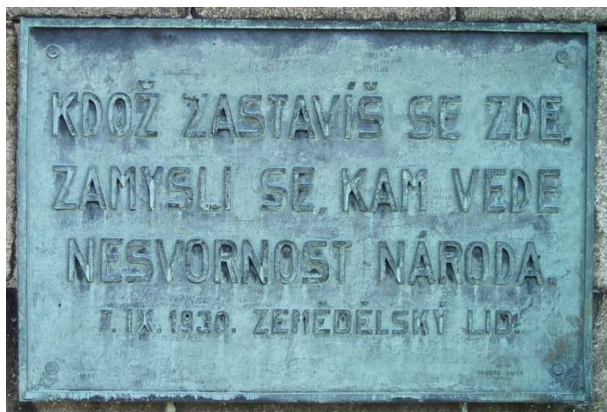
Kdož zastavíš se zde, zamysli se, kam vede nesvornost národa. 7.IX.1930 Zemědělský lid