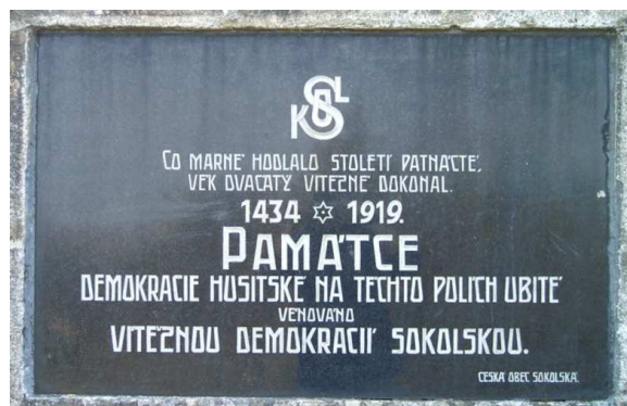
Co marně hodlalo století patnácté věk dvacátý vítězně dokonal 1434 * 1919 Památka demokracie husitské na těchto polích obité věnováno vítěznou demokracií Sokolskou Česká obec Sokolská