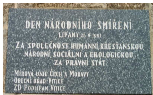
Den národního smíření Lipany 25.V.1991 Za společnost humánní křesťanskou národní, sociální a ekologickou, za právní stát Mírová unie Čech a Moravy Obecní úřad Vitice ZD Podlipan Vitice