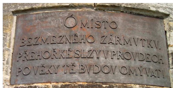
Ó místo Bezmezného zármutku přehořké slzy v proudcích po věky tě budou omývat