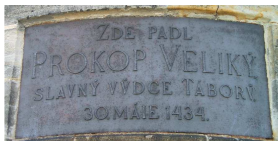
Zde padl Prokop Veliký slavný vůdce Tábořský 30.máje1434